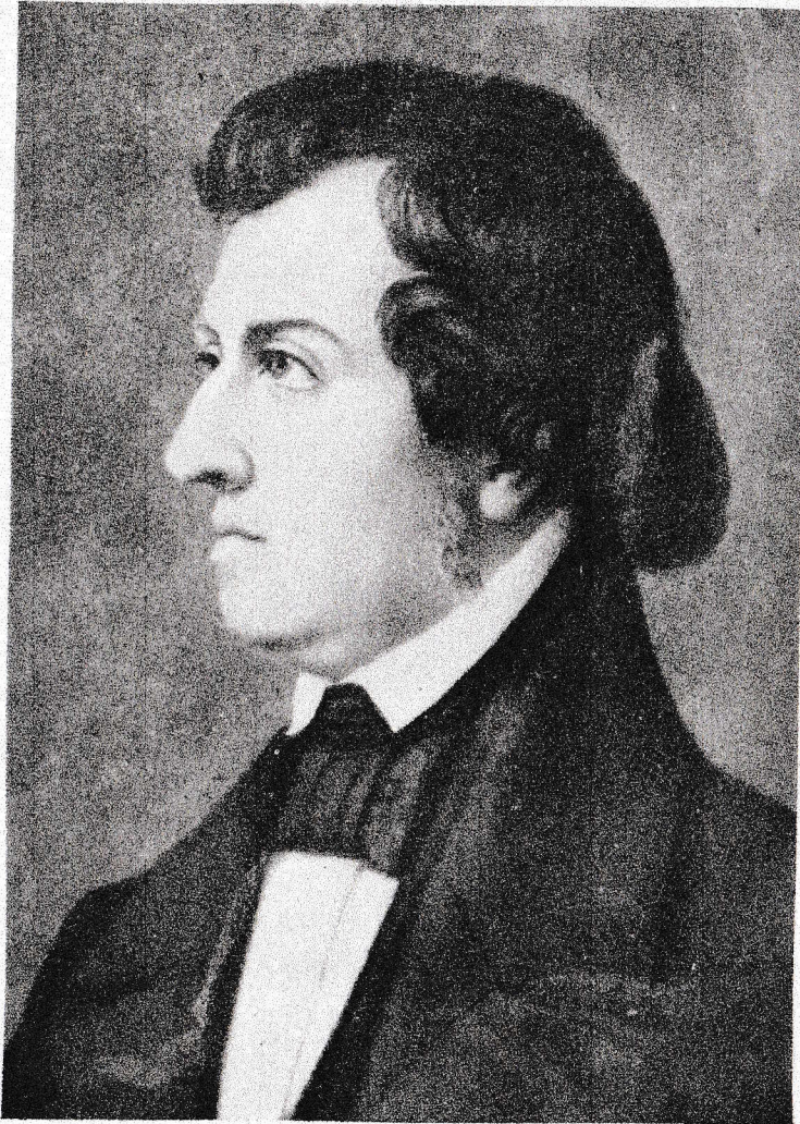
シ ョ パ ー ン